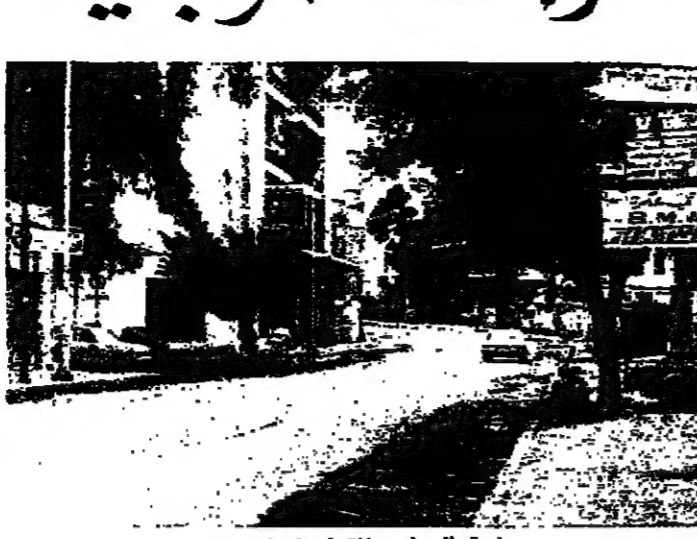
طريق بيروت - لتلف في الماء للصف

ويؤكد عون ان الوضع القائم في المنطقة الشرقية، انما هو نتيجة لظروف تاريخية، ويحسبون ان تقاسيم حرقا من قبل اللينين والقيمين والوساطة لتتوصل الى حل. وتعود دورة العنف، لتكتمل على ما تبقى، كما حدث في الاسبوع لاسم التي سبقت الاسبوع.